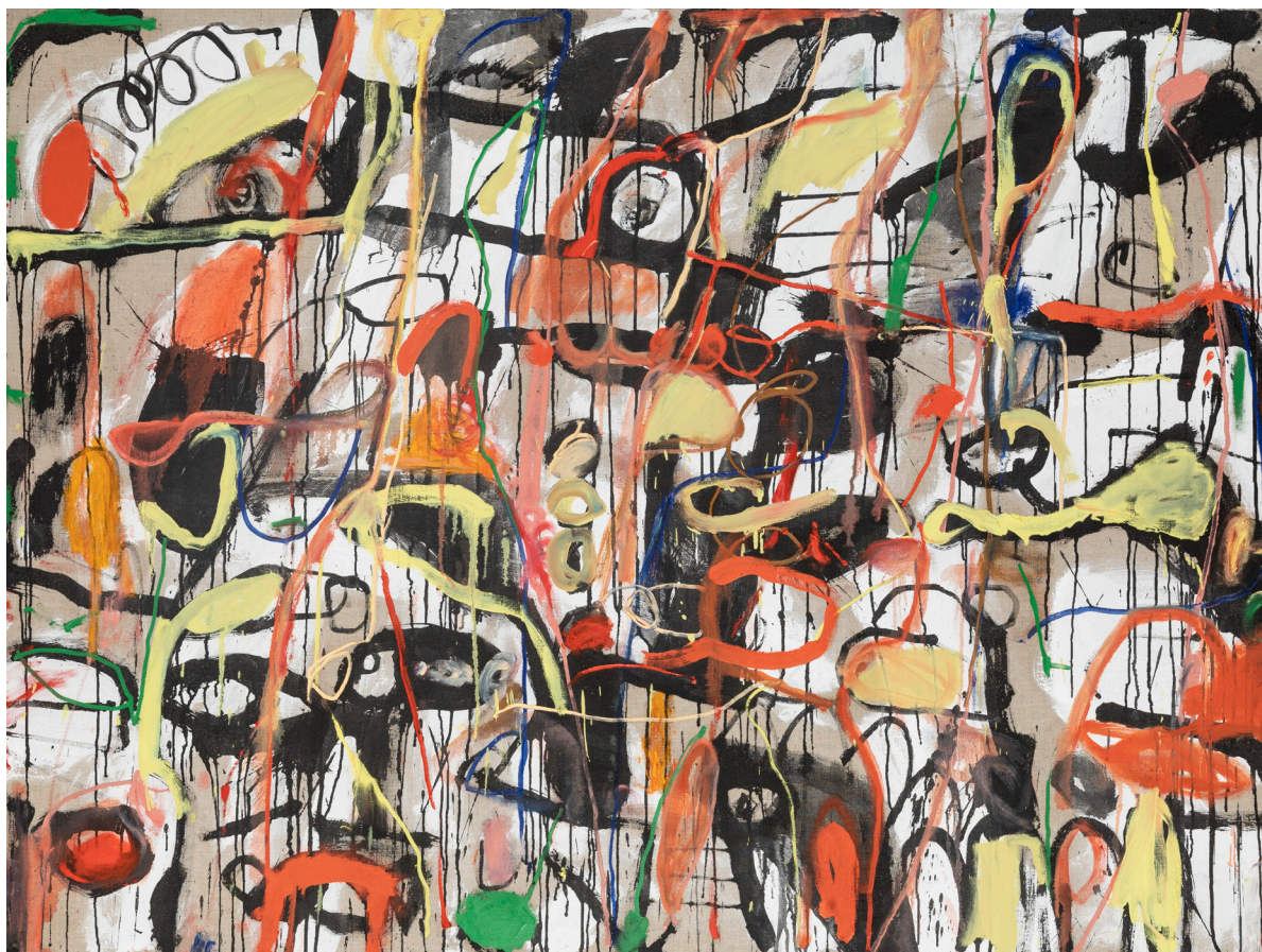
Stefan de Jaeger, Altération , 2023. Huile sur toile, 150 x 200 cm. Signée, datée.