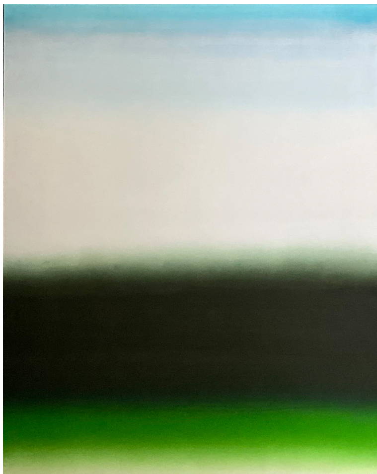
Philippe Micheau-Ruiz, Happy Landscape , 2021. Acrylique et Mica sur toile, 92,5 x 73 cm. Signée.