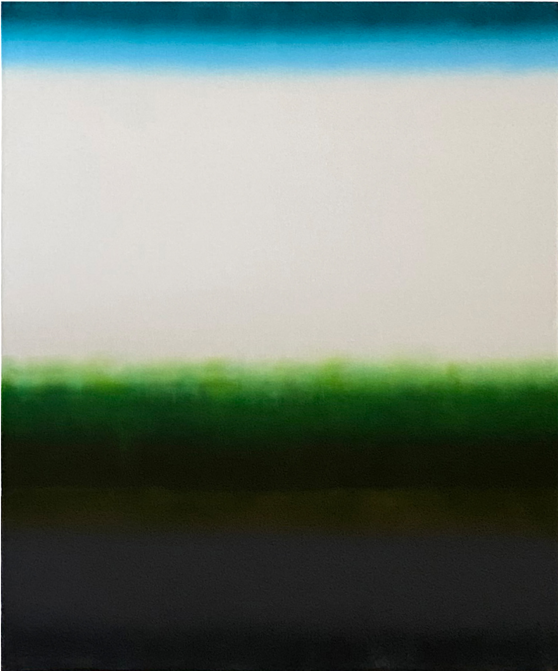
PHILIPPE MICHEAU-RUIZ Walking by the River , 2021 Acrylique et Mica sur toile 100 x 81 cm Pièce unique Signée